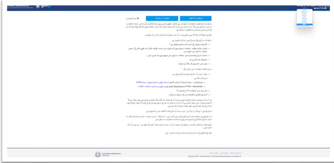
(تصویر 1): اندراج کے پروگرام (شیڈول) کی درخواست کا ابتدائی صفحہ

تیسری دنیا کے ممالک کا شہری وزارت برائے پناہ اور ہجرت کے صفحہ میں داخل ہو کر اندراج کے پروگرام (شیڈول) کی ابتدائی صفحہ پر داخل ہو سکتے ہیں (تصویر 1)۔