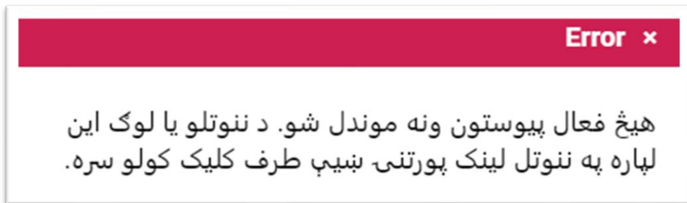
شکل 2: د ننوتلو (لوگ این) پیغام

که چېرې PTX یا د دریم هیواد په دی تڼۍ کلیک وکړئ د غوښتنلیک پیژندنه یا په خوندي شوي غوښتنلیک ، لاندی پیغام به ښکاره شي (شکل 2):