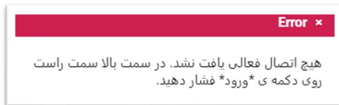
تصویر ۲: پیام ورود

ورود درخواست کلیک کنند، پیام ظاهر می شود. (تصویر ۲)