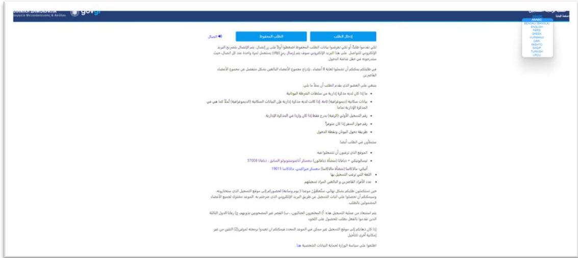
الصورة 1: الصفحة الرئيسية للطلب الإلكتروني لبرمجة التسجيل

عند دخول مواطن البلد الثالث (ΠΤΧ) إلى صفحة وزارة الهجرة واللجوء يستطيع أن يدخل إلى الصفحة الرئيسية لطلب برمجة التسجيل (الصورة 1).